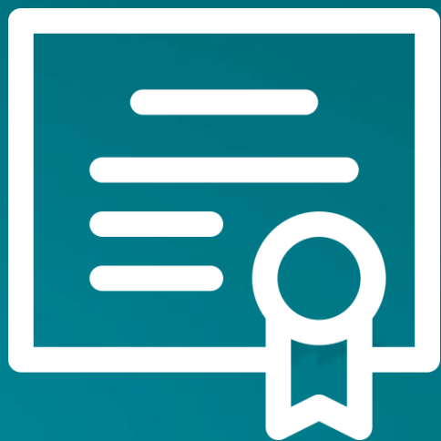
Документ об образовании